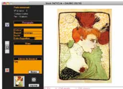
Interface d'intégration des visuels d'une œuvre